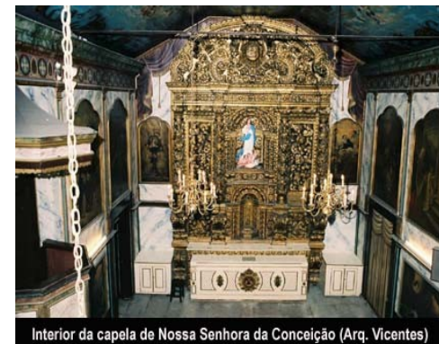
Interior da capela de Nossa Senhora da Conceição (Arq. Vicentes)